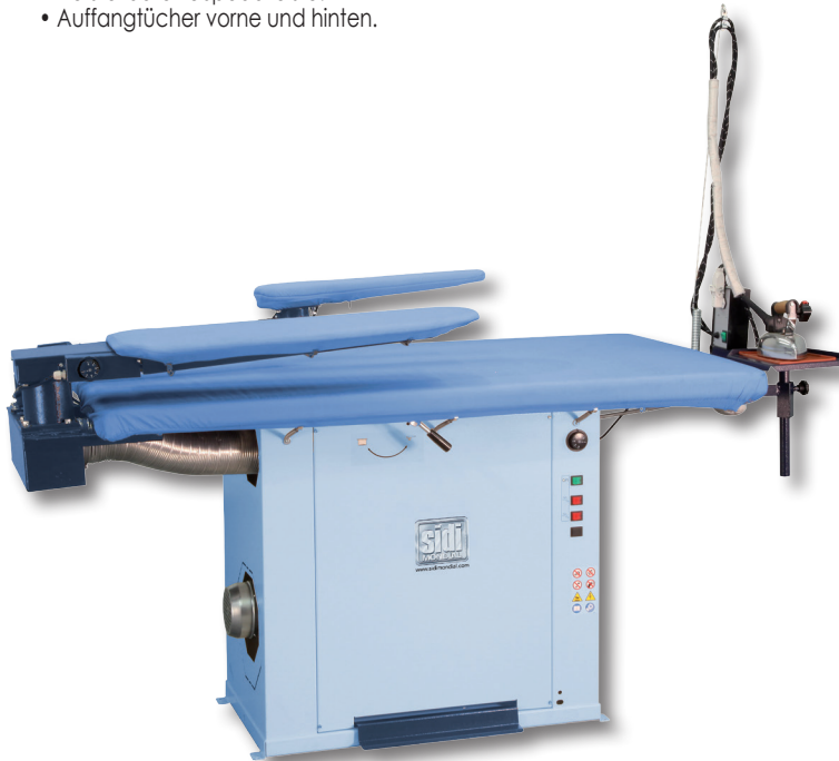
SPA Maxi +F3+F9